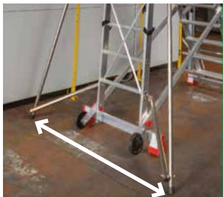
Stabilizzatori aperti. Open stabilisers.