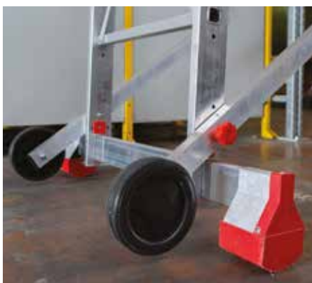
Nuova base stabilizzatrice. New stabilizer base.