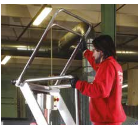
Accesso facile e sicurezza a 360°. Easy access and a 360°.