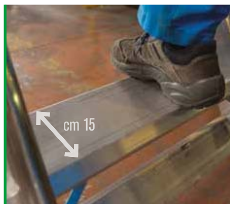
Gradino da 15 cm. per una salita sicura. 15 cm steps ensuring safe climbing.