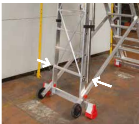
Stabilizzatori chiusi. Closed stabilisers.

Massima sicurezza antiribaltamento con gli stabilizzatori laterali che, una volta chiusi, facilitano lo spostamento della scala. Maximum anti-tilting safety with side outriggers which, once closed, facilitate movement of the ladder.