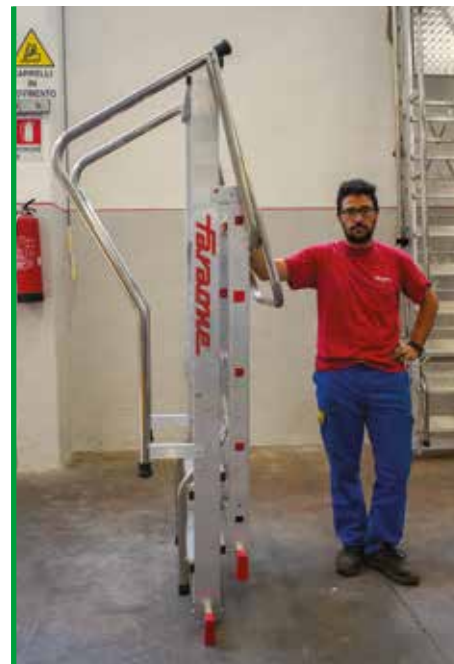
Ingombro ridotto per un facile trasporto. Compact size for easy transportation.

50.000 resistance/cycles EN 131-2: 2018 USO PROFESSIONALE PROFESSIONAL USE