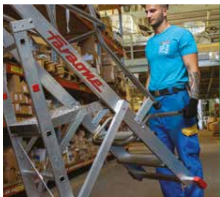
Facile e comoda da spostare. Easy to move.